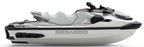
○ White Pearl Premium