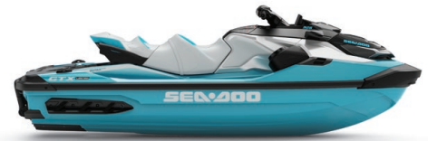
● Teal Metallic