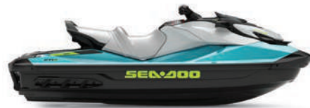
GTI™ SE 170