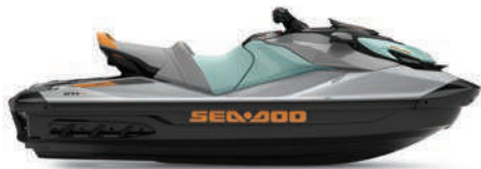
GTI™ SE 170