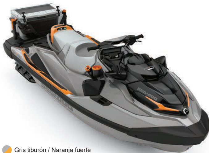
● Gris tiburón / Naranja fuerte